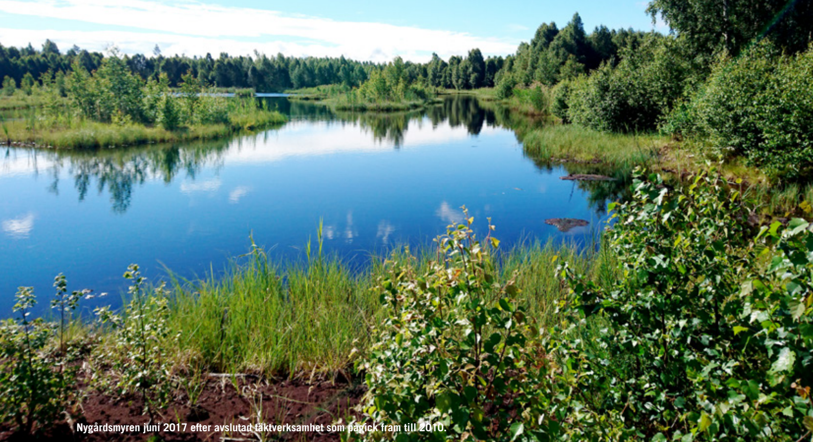
Nygårdsmyren juni 2017 efter avslutad täktverksamhet som pågick fram till 2010.