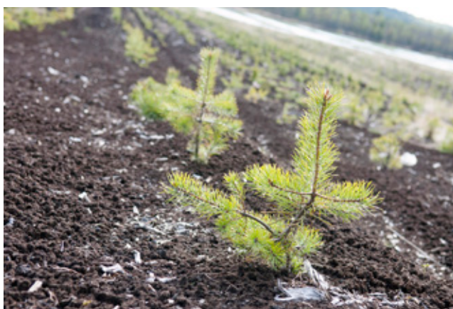
Foto tv: Alsmyrn, här pågick produktion till och med 2013, bilden är tagen 2016

Idag söker man i regel täktverksamhet på en yta motsvarande ca 25 år och finns det tillräckligt med torv kvar då tillståndstiden närmar sig utgång, kan man välja att söka nytt tillstånd för fortsatt verksamhet. Totalt kan produktion pågå upp till ca 35-45 år. Under den här tiden hinner det hända mycket både politiskt och i närmiljöerna kring torvtäkten.